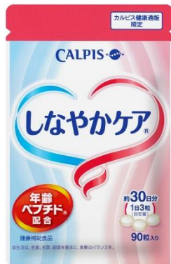
パウチタイプ 90粒入り・約30日分

医療関係者の方へ：ご相談を受けた際は、下記の情報をご確認のうえ、ご判断をお願いいたします。