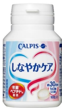
ボトルタイプ 90粒入り・約30日分